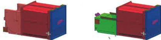
TM 15 SX / TM 15