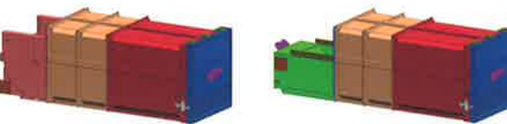
TM 25 SX / TM 25