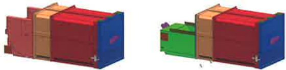
TM 20 SX / TM 20